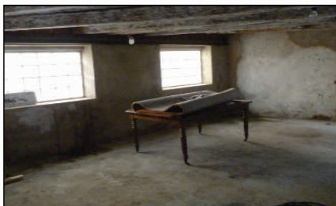
Local qui entreposera les livres dont les travaux de finition sont en cours.