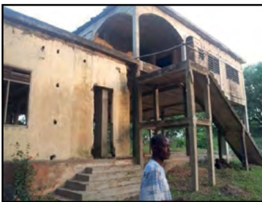
Le bâtiment de la bibliothèque à Atakpamé et son intérieur

Parmi les lieux visités ces dernières années, le campus de l'UPAO-Atakpamé, au Togo, est un véritable coup de cœur ! Nous leur souhaitons d'avoir des professeurs en résidence venant de France & de Suisse, et en attendant, la CLCF les soutient dans leur projet d'aménagement de leur grande bibliothèque inachevée.