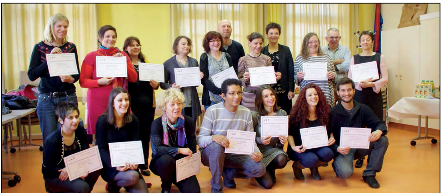
Remise des diplômes en bibliothéconomie à l'ABF Mulhouse

Je suis à présent employée à 80% et toutes ces améliorations permettent à la CLCF, au bout de trois ans de reprise, de relancer l'ensemble de ses activités. Cette lettre de nouvelles en est le reflet...merci pour vos encouragements, vos dons et votre présence : c'est ensemble que nous portons ces projets !