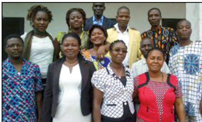
Les onze stagiaires participant à la formation d'auxiliaires de bibliothèque

Le pasteur et professeur Omer Dagan a invité la CLCF à organiser une session de formation d'auxiliaires de bibliothèque sur le campus de l'UPAO. Onze stagiaires ont répondu positivement à l'appel, pour un total de cinq nationalités. Le programme, intense, a permis d'aborder tous les aspects indispensables de la bibliothéconomie, sans oublier les visites de bibliothèques déjà informatisées, de maisons d'édition ou encore les examens oraux et écrits. L'ensemble des stagiaires sont repartis avec une attestation de réussite, fatigués mais conscients de la nécessité de se former pour être de vrais professionnels. Toute notre gratitude va à l'ensemble de l'équipe de la bibliothèque de l'UPAO et son responsable.