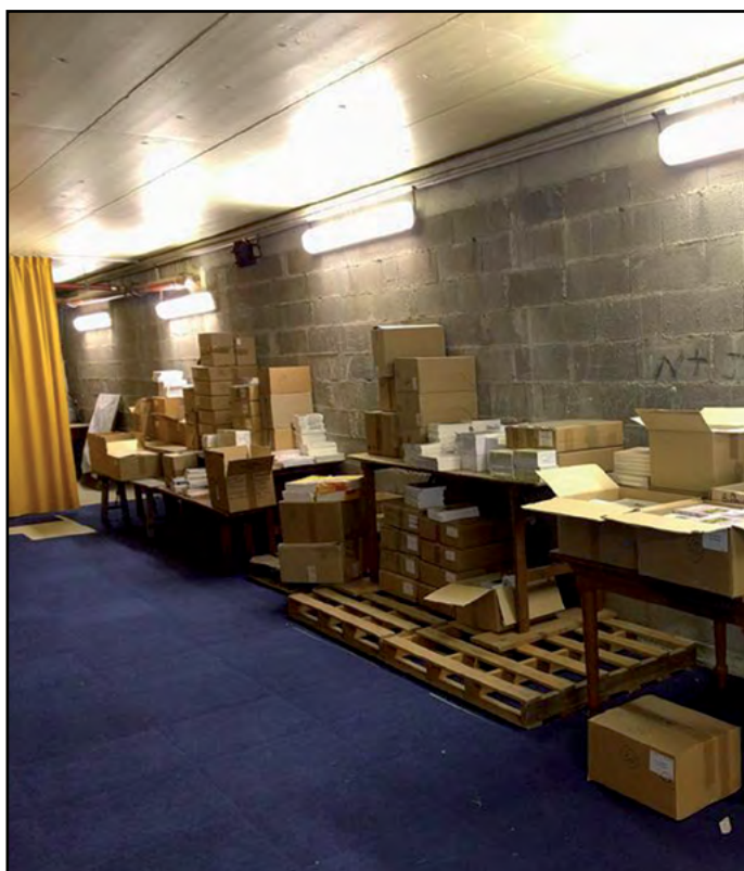
Un aperçu du stock de la CLCF dans le sous-sol du foyer protestant de Schiltigheim.

Gloire à Dieu pour cette solidarité protestante qui ne se dément pas !